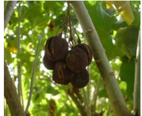
le pourghère ( jatropha curcas ).

Ce débat a suscité un nouvel intérêt orienté vers l'exploration d'une deuxième génération de