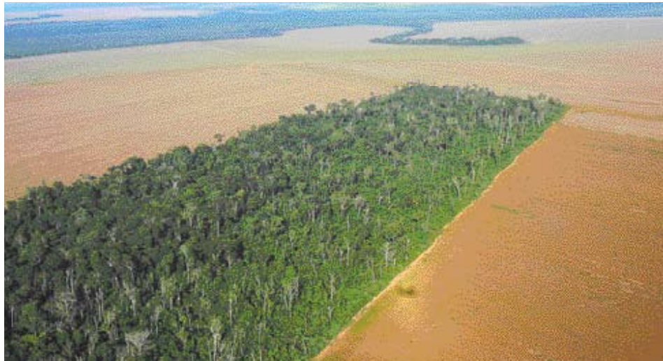
déforestation par la production de soja au Brésil.

Les agrocarburants représentent une source d'énergie fondée sur la monoculture de produits tels que le soja, le sucre de canne et le maïs alors que les biocarburants représentent une source d'énergie renouvelable d'origine biologique comme le bois de chauffage, le charbon, le fumier, le biogaz, le biohydrogène et les déchets agricoles. Nous comprenons ainsi l'intérêt qu'ont les producteurs d'agrocarburants de favoriser le terme bio au terme agro. De cette façon, ils veulent se soustraire aux questions allant à l'encontre de cette proposition alternative puisqu'elle implique de graves impacts sociaux, environnementaux et économiques ; ces derniers pourraient entraîner des conflits sociaux attribués à la raréfaction de la nourriture, à la dégradation de la nature, à la pollution des sols et des eaux et aux déséquilibres territoriaux.