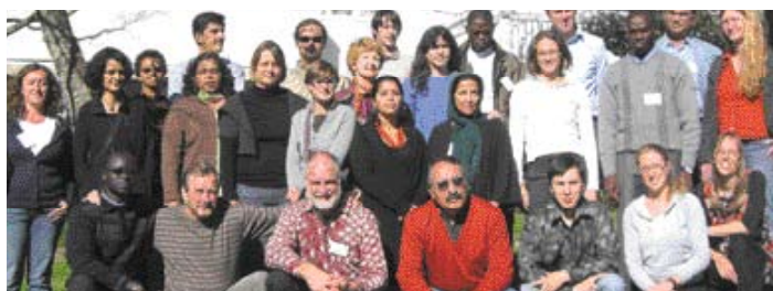
L'équipe Drynet en Afrique du Sud.

Par le partenaire Drynet, Both ENDS, aux Pays-Bas.