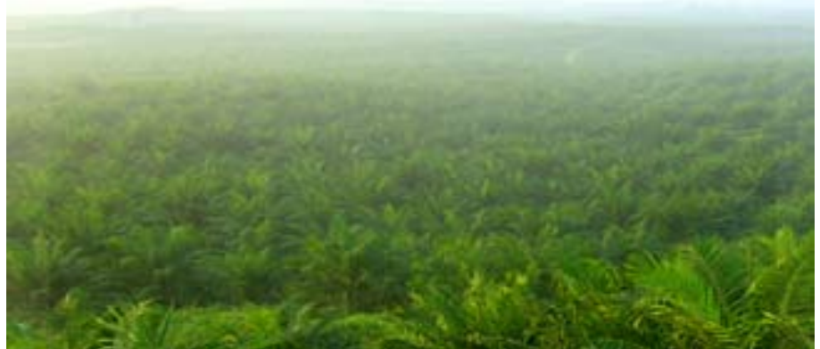
une plantation de palmiers à huile au Brésil.

Au plan social, la critique est actuellement orientée sur la contribution de la filière biocarburants à l'enchérissement des prix des produits agro-alimentaires et l'aggravation de la pauvreté dans les pays sous développés. Cette situation semble actuellement se substituer à l'accusation du dumping long-