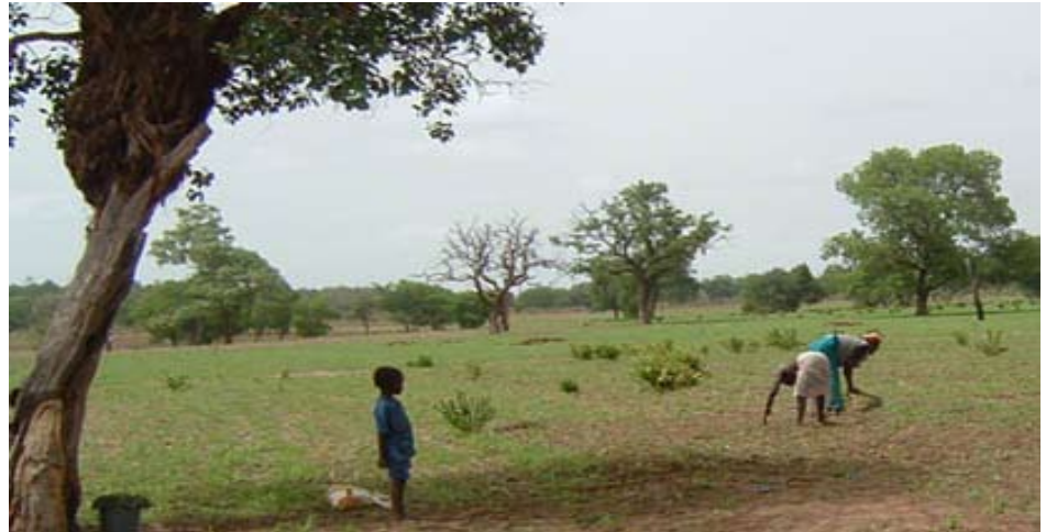
Travaux champêtres, Sénégal.

Le projet est réalisé dans le vieux bassin arachidier, à Diourbel, à Fatick et à Louga, zones caractérisées par un climat de type soudano sahélien avec une saison sèche de longue durée. La pluviométrie, irrégulièrement répartie, y est très variable d'une année à l'autre. La végétation, quand à elle, constituée par des épineux, des baobabs et tamariniers, se trouve affectée par la sécheresse et les actions anthropiques. La quasi-absence de forêts classées dans le milieu, y fragilise extrêmement les écosystèmes. Une analyse